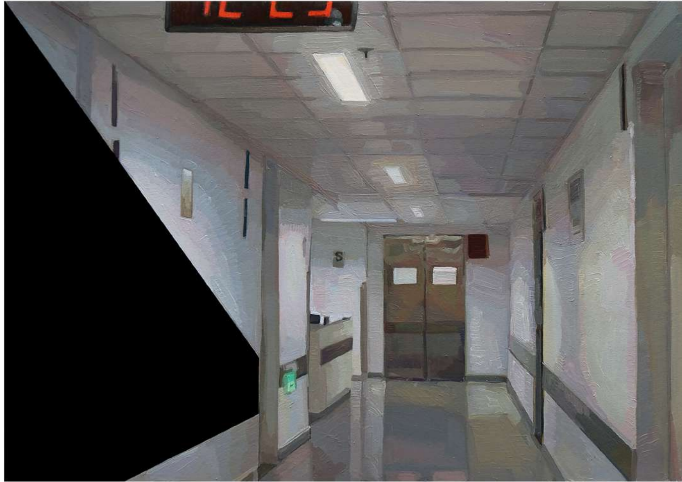
Pieza 1. Hospital Loayza. Técnica mixta, óleo e impresión fotográfica sobre papel. 29 x 42 cm.