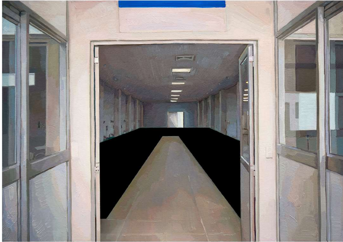
Pieza 2. Hospital Almenara. Técnica mixta, óleo e impresión fotográfica sobre papel. 29 x 42 cm.