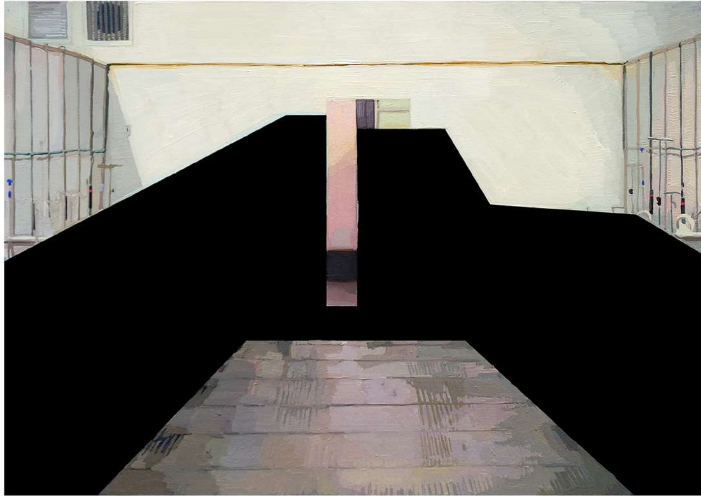
Pieza 6. Hospital Mongrut. Técnica mixta, óleo e impresión fotográfica sobre papel. 29 x 42 cm.