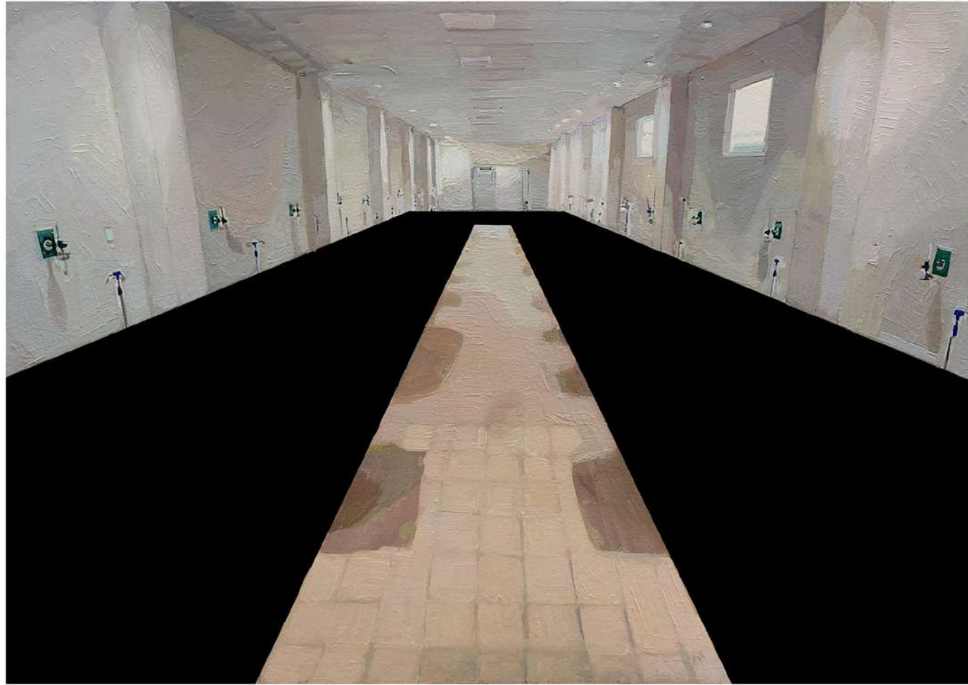
Pieza 8. CERPS Hospital Almenara. Técnica mixta, óleo e impresión fotográfica sobre papel. 29 x 42 cm.