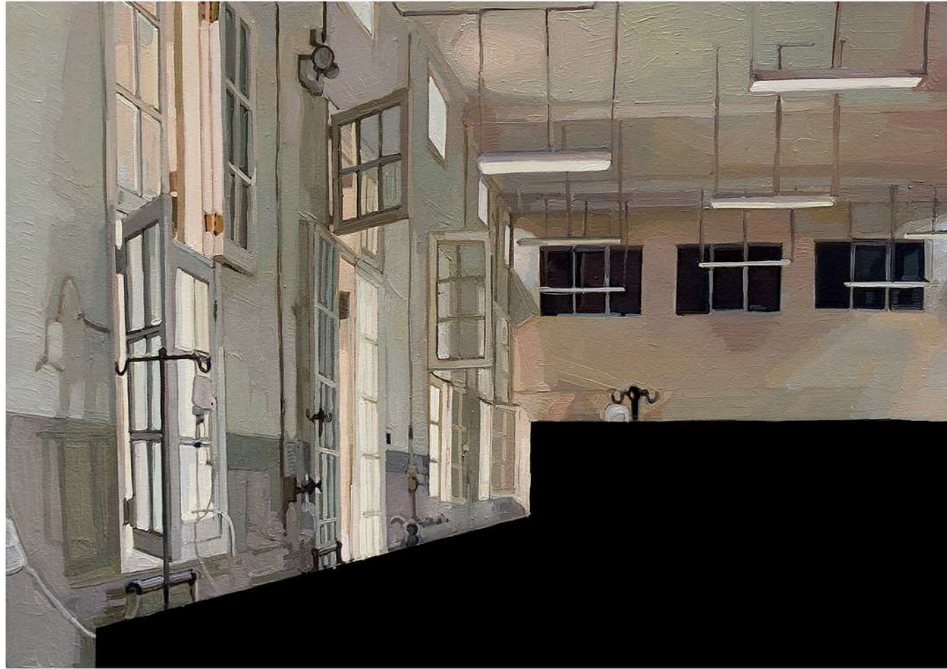
Pieza 9. Hospital Loayza Técnica mixta, Oleo e impresión fotográfica sobre papel.