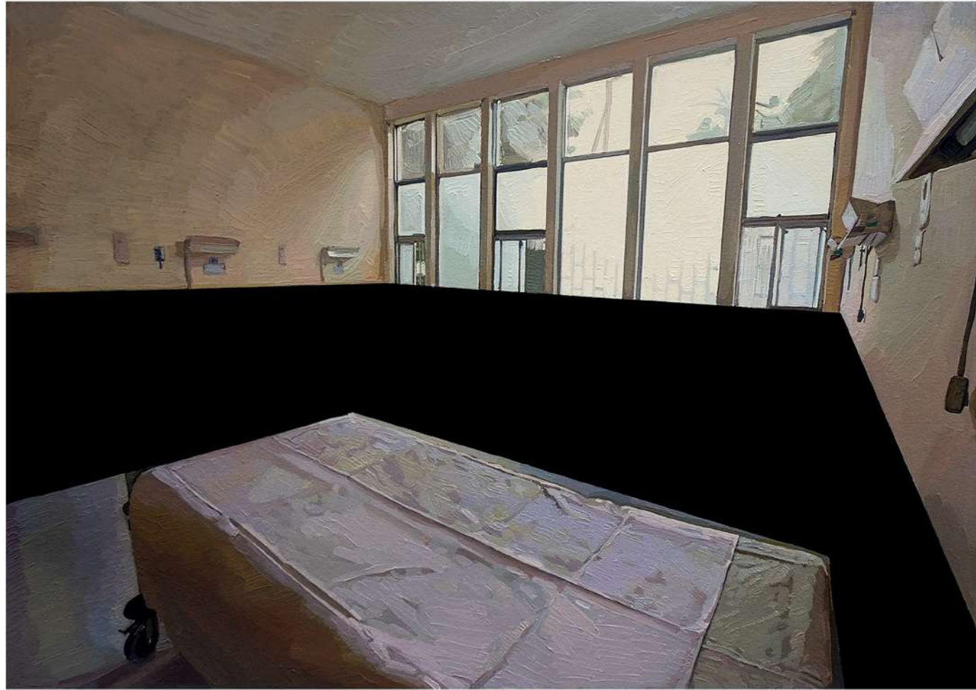
Pieza 5. Hospital Dos de Mayo. Técnica mixta, óleo e impresión fotográfica sobre papel. 29 x 42 cm.