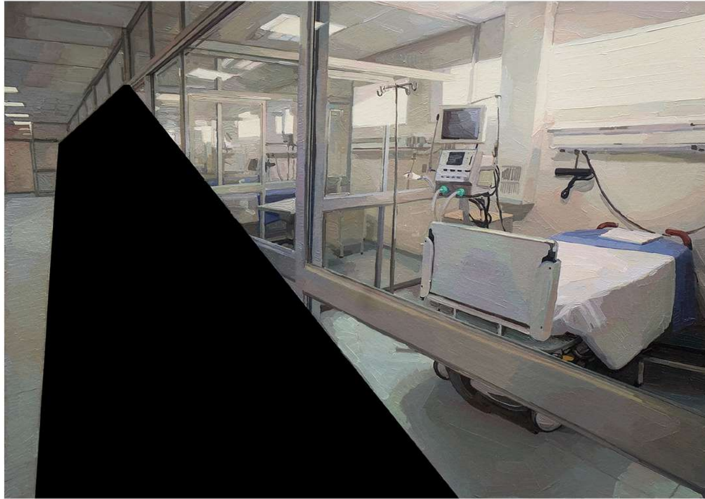
Pieza 3. Hospital Rebagliati. Essalud Box. Técnica mixta, óleo e impresión fotográfica sobre papel. 29 x 42 cm.